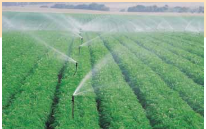
Mamkad 16 Tabla de Rendimiento - Boquillas de trayectoria elevada

Miniaspersor impulsado a bolilla de bajo volumen Rosca macho de 1/2” montado sobre el Irristand 5l o en elevador